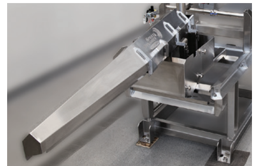
Conjunto de tampa articulada