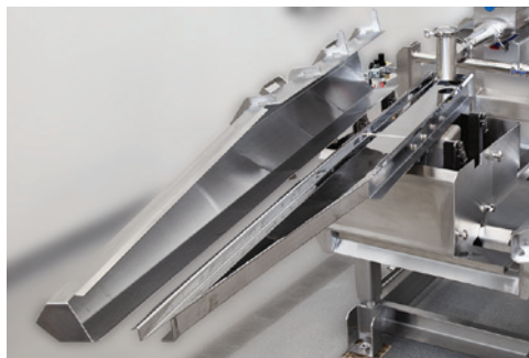
Projeto de bandeja com corte em viés para cobertura ideal